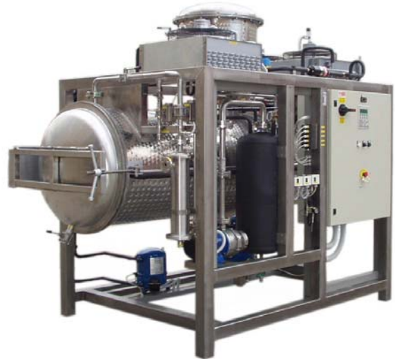
DRY a sequedad (250-1000)