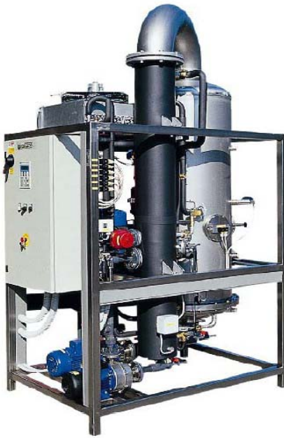
DPE-HP (250-2500 l/día)