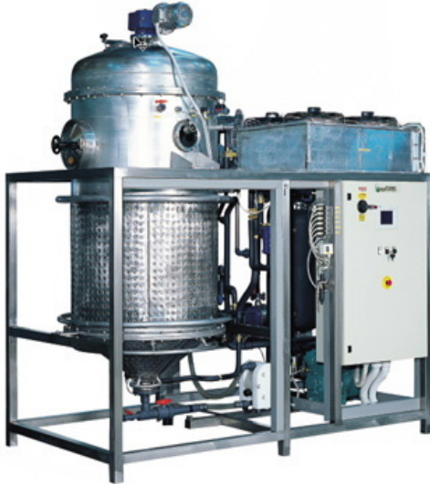
VRHP con rascador (250-3000)

Your partner for environmental solutions